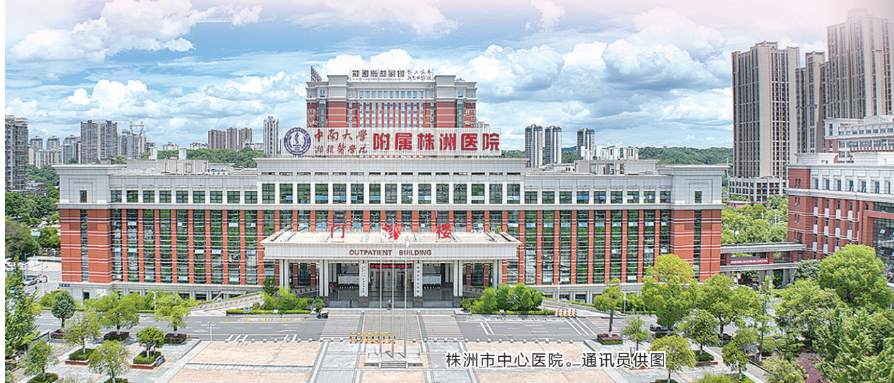
株洲市中心医院。

三十年,她们日复一日的坚守,丈量了生命的长度。这不仅是个人职业生涯的刻度,更是一座城市医疗卫生事业厚度的缩影。向所有坚守在一线的护理工作致敬!