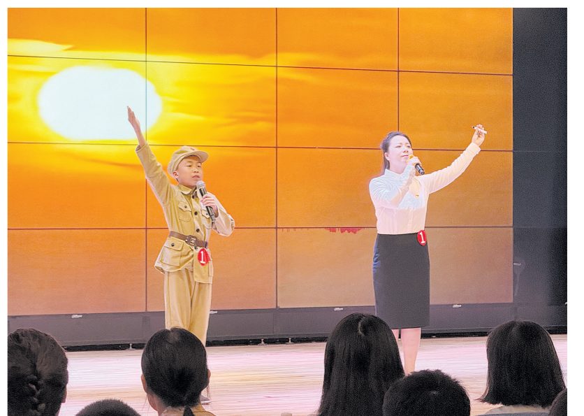
师生共同讲述英烈故事。

“这不是一次简单的回访,而是一次育人模式的有力实践。通过学长引领、朋辈互助,让成长在传承中焕发新的力量。”市二中枫溪初中部相关负责人表示,本次学长团活动,不仅是学校深化优质教育资源共享的缩影,更是从校级迈向区域辐射的关键一步。学校将深度推进教育资源的融合互通,打破学段壁垒,构建纵向协同、横向联动的育人新生态。