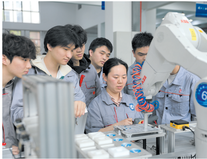
订单班学生在导师指导下学习技能。

服务产业与民生,学院打出“培训组合拳”。面向企业职工、院校学生和就业重点人群,落实“技能照亮前程”培训行动,与中车株洲电机有限公司共同承办“匠心杯”职业技能大赛,赛场上比拼技艺,赛场下开展配套技能提升培训;联合株洲南方普惠航空发动机有限公司开展特种作业安全技术培训,为企业安全生产加上一把“技能锁”;与中