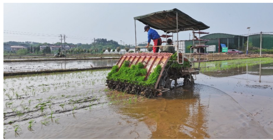
高速插秧机在田间作业

株洲日报讯(全媒体记者/陈洲平 通讯员/胡雨晴 周煌) 连日来,气温稳步回升,茶陵早稻插秧工作拉开帷幕。4月10日,该县界首镇星火村龙下铺水稻种植基地,采用搭载北斗系统的高速插秧机,让春耕生产跑出加速度。 当天,在龙下铺水稻种植基地里,两千余亩水田平整开阔,3台高速插秧机在田间来回穿梭,稳步作业,一株株青翠饱满的秧苗精准植入泥土,行距、株距规整划一。短短不到半小时,原本空旷的水田便被披上了一层鲜亮的绿装,勾勒出春日农耕的动人画卷。 春耕效率的大幅跃升,离不开科技赋能加持。该基地使用的机械化插秧设备均搭载北斗导航系统,借助卫星精准定位,插秧机可自动调节插秧深度、控制秧苗株距,作业精度达到厘米级,有力保障每亩水田有效穗稳定在2万穗以上。该项技术不仅实现了早稻科学合理密植,更为全县水稻大面积单产稳步提升筑牢了技术根基。