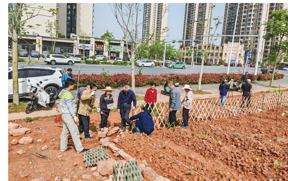
居民在城市共享菜园里劳作,感受劳作带来的乐趣,受访者供图