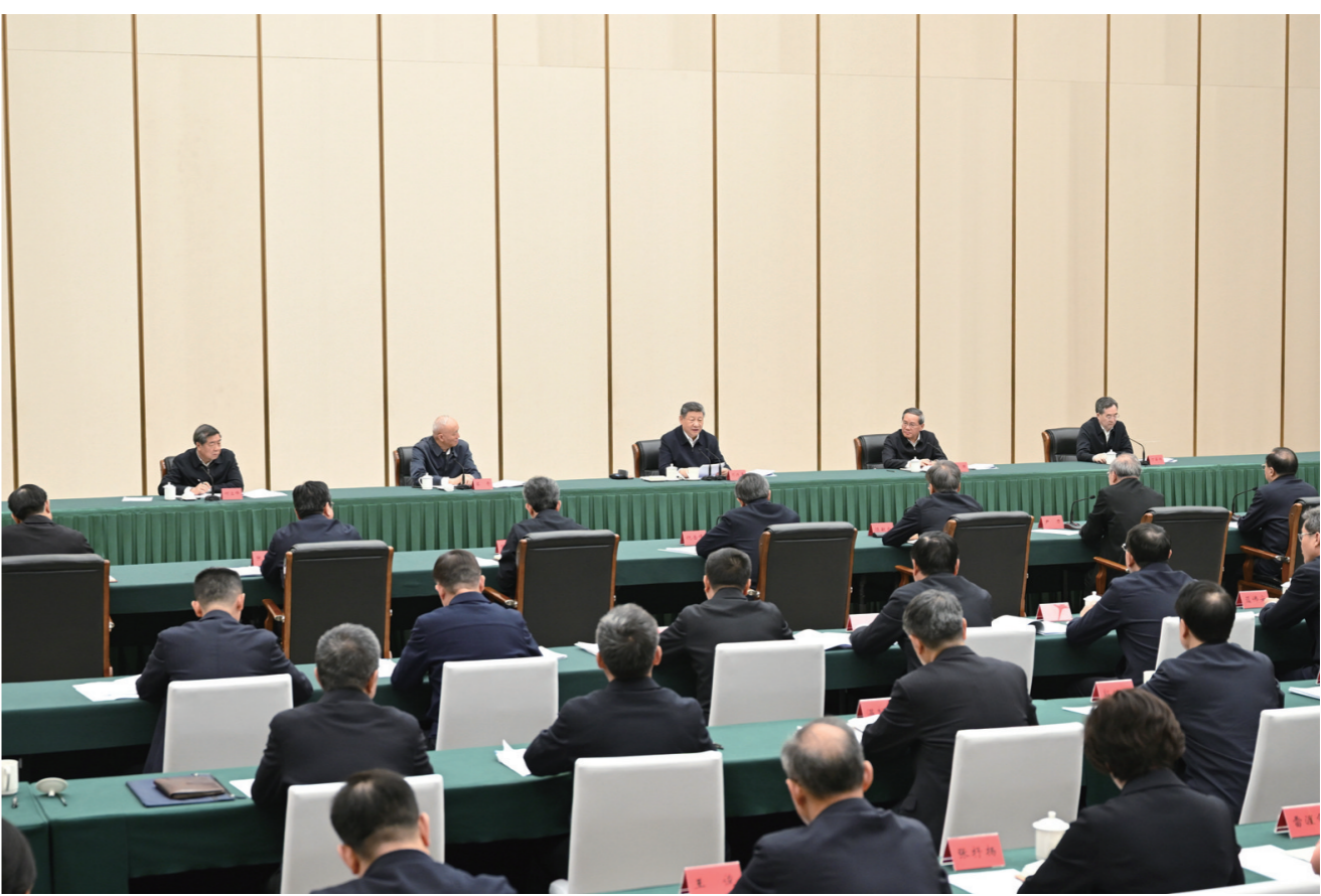
23日下午,习近平主持召开深入推进雄安新区高质量建设和发展座谈会并发表重要讲话。

安新区。习近平走进企业运营监控与应急指挥中心,听取企业搬迁、产业布局、创新发展等情况介绍,察看企业实时运营数据和远程图像。他强调,要以迁入雄安新区为契机,激发企业职工创新创业的积极性主动性,为加快建设新型能源体系、建设能源强国作出新贡献。 在公司一层大厅,习近平同雄安新区入驻和在建疏解单位干部职工代表亲切交流,询问大家的工作生活情况,肯定大家为新区建设发展付出的努力,