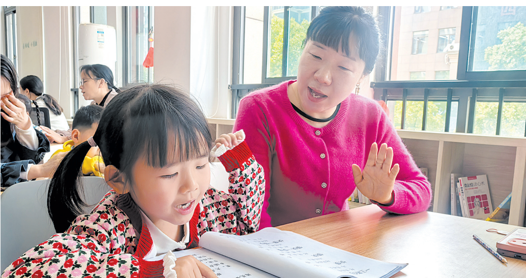
栗雨街道各个社区的“益起共享”幸福文体学院,成为居民家门口的“幸福加油站”。

栗雨街道相关负责人介绍,2026年,街道将继续拓展课程门类,挖掘更多“社区公益人”,让“益起共享”幸福文体学院成为居民家门口的“幸福加油站”。用文化润心、体育强身,真正构建居民可感可及的良好“人居生态”。