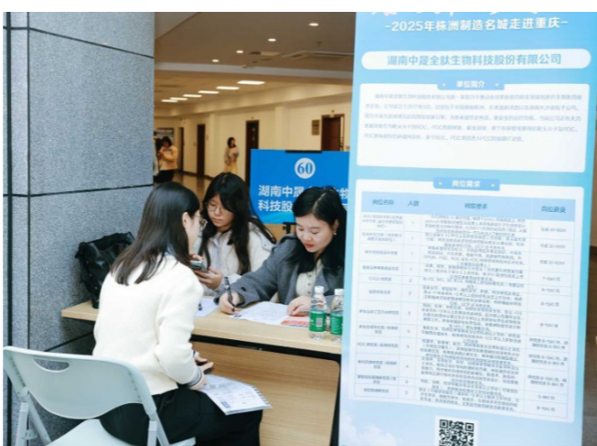
“智汇潇湘·才聚株洲”高校双选会现场(资料图)。

一是启动时间早,活动频次高。例如,3月13日、15日将分别在长沙理工大学、中南大学率先举办两场大型双选会。西安站的行程也已排定:3月24日、25日、27日将分别在陕西师范大学、长安大学、西安交通大学组织座谈会与双选会。3月26日,将在南昌大学组织大型双选会;3月26日、27日将分别在武汉理工大