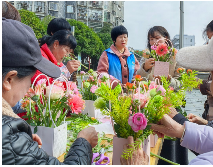
爱在雷锋月,情暖妇女节

近日,天元区马家河街道高塘社区联合株洲市医疗保障局、北汽株洲分公司超级工厂团(总)支部开展“爱在雷锋月,情暖妇女节”活动,通过