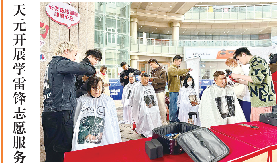
天元开展学雷锋志愿服务

体现在人居生态的“深度融合”上:组建高科文旅,通过办赛办会办展,打通“产、城、人、文”融合链条。