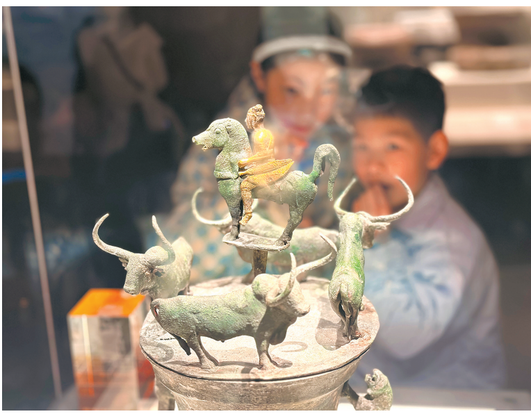
同学们走进博物馆了解历史

现在能独立在初级道滑行,太有成就感了!”在哈尔滨的室内雪场,二中枫溪学校初中部学生宇辰,脸上洋溢着自信的笑容。这个春节,他和父母奔赴冰城,在冰雪天地中开启了一场“技能解锁之旅”。