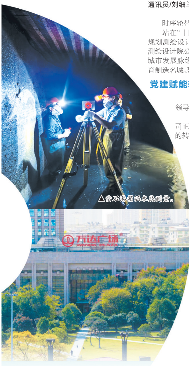
▲雷石塔筒筒体测量。

“规划的初心,是把城市发展的愿景转化为市民可感可及的幸福。”市规划测绘设计院公司相关负责人表示,公司将持续深耕国土空间规划、城市更新、乡村振兴等核心主业,以市场需求为导向重塑服务逻辑,从单纯项目交付转向深度挖掘需求与创造价值,让每一份规划都精准对接“培育制造名城、建设幸福株洲”的战略蓝图。