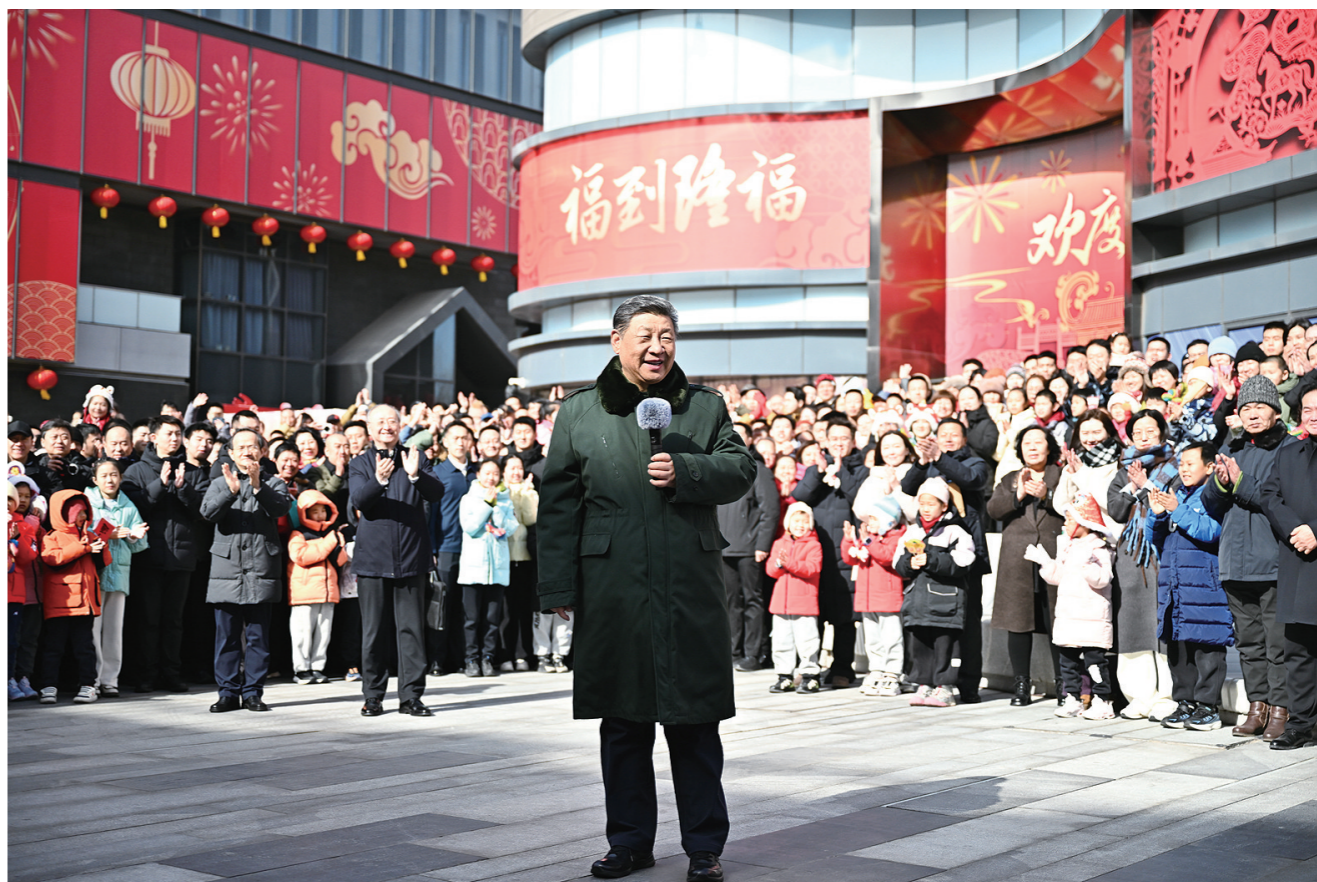
10日上午,习近平在东城区隆福寺街区考察时,向全国各族人民和香港同胞、澳门同胞、台湾同胞、海外侨胞致以美好的新春祝福。

新华社电 中华民族传统节日春节即将到来之际,中共中央总书记、国家主席、中央军委主席习近平在北京看望慰问基层干部群众,向全国各族人民和香港同胞、澳门同胞、台湾同胞、海外侨胞拜年!祝愿海内外中华儿女在农历马年龙马精神、身体健康、事业有成、阖家幸福!祝愿伟大祖国山河锦绣、风调雨顺、繁荣昌盛、国泰民安! 2月9日至10日,习近平在中共中央政治局委员、北京市委书记尹力和市长殷勇陪同下,深入科创园区、养老服务街区、新春市集考察,给基层干部群众送上党中央的关怀和祝福。 9日上午,习近平来到位于北京亦庄的国家信创园,详细了解信息技术创新