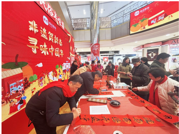
书法爱好者挥毫泼墨,为市民免费书写春联。