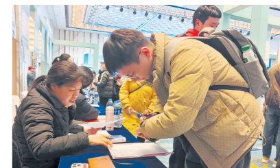
▲株洲春风行动招聘会现场,求职者在投递简历。