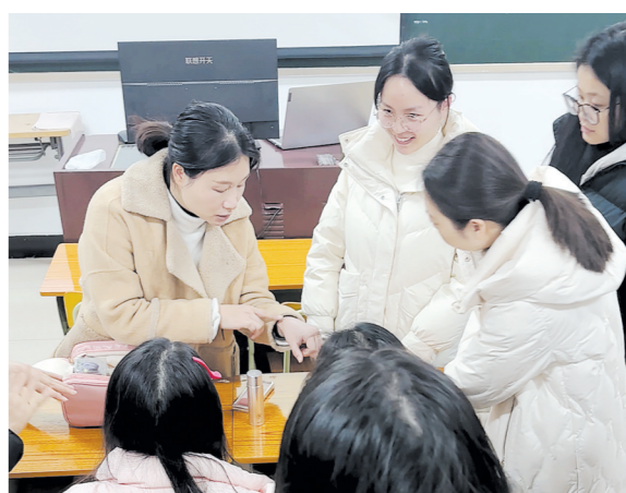
美妆造型课上,老师为学生做现场示范。记者/戴凛 摄

“哇,原来可以这样!”实操环节,大家纷纷尝试,教室里不时响起感叹。同学们表示,这样的课堂不仅是教授技能,更是在传递一种与时俱进的思维方式。