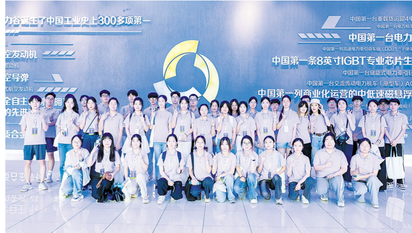
▲去年7月,300名大学生来株洲就业游。

我市已连续15年开展“技能月”主题活动,连续10年举办“技能天下”职业技能网络直播大赛,连续5年举办“株洲职教杯”系列技能竞赛。易冉、柳祥国、邓元山获评“大国工匠”,60人获得“大国工匠”“中华技能大奖”“全国技术能手”等国家级荣誉,300余人获得“湖湘工匠”“湖南省技能大师”“湖南省技术能手”等省级荣誉。