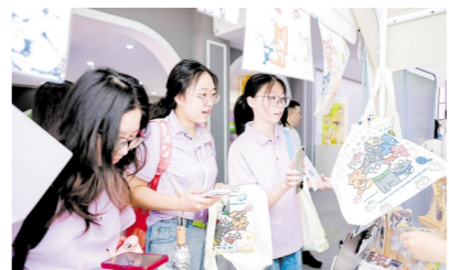
▲参加株洲就业游的大学生在就业集市上。