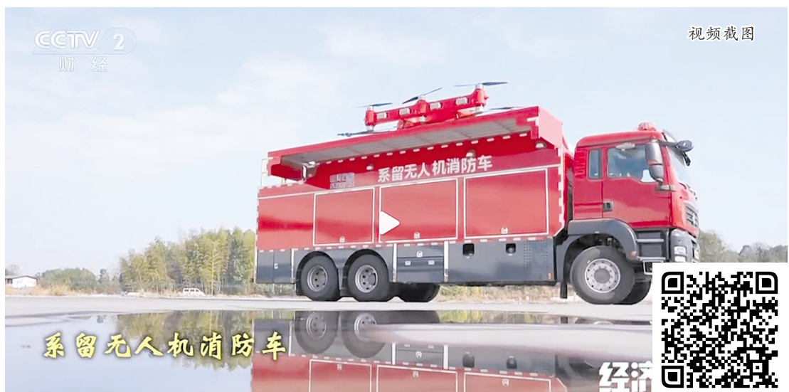
视频从第18分钟开始,讲述株洲将无人机与特种车辆深度结合的系留无人机消防车,堪称高层建筑灭火的“杀手锏”。