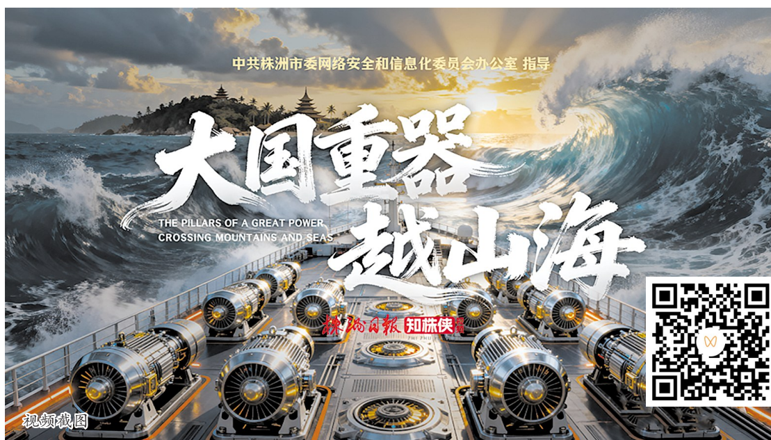
打造大国重器,擦亮国家名片,株洲勇挑高质量发展的大梁。文字、图片、视频/知株侠