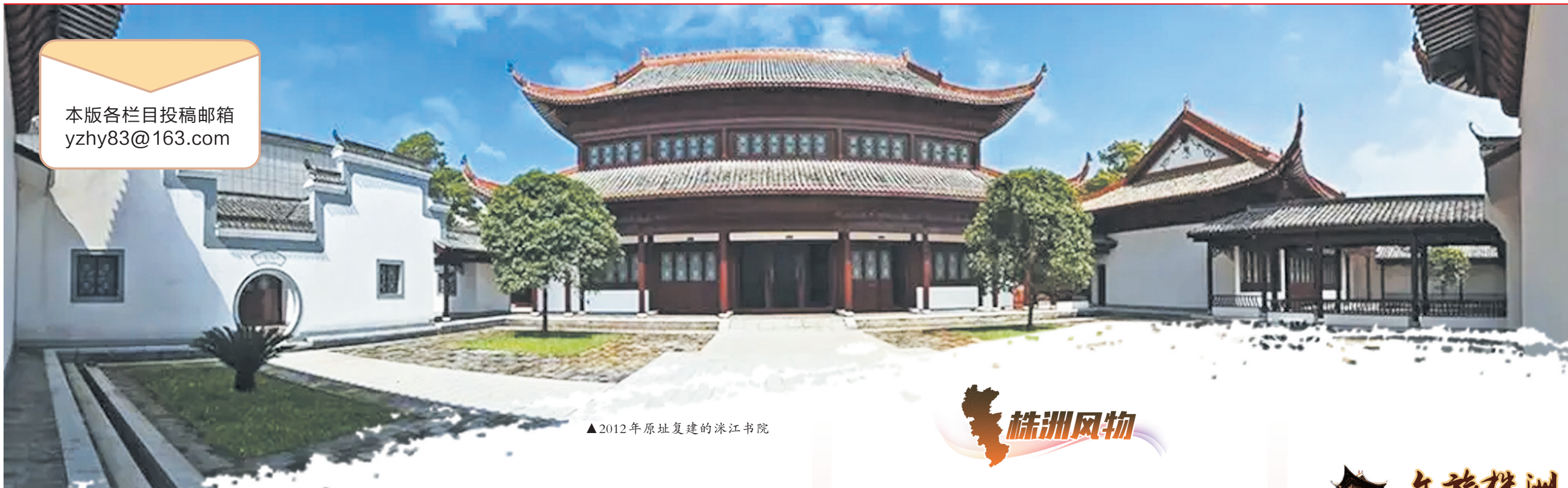
▲2012年原址复建的沱江书院