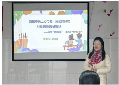
心理专家授课中,通讯员供图

为帮助家长破解育儿难题,搭建和谐亲子桥梁,1月3日,株洲市三医院精心策划举办了第一期PET父母效能训练课程。此次课程以科学实用的沟通技巧为核心,为众多面临育儿困惑的家长带来了一场兼具温度与干货的充电之旅。