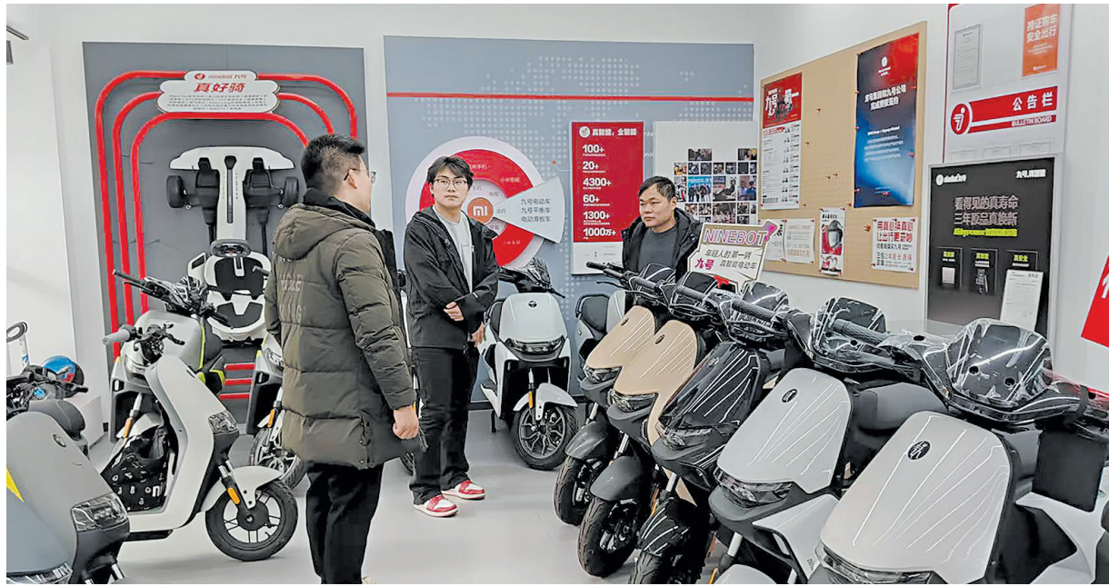
顾客进店咨询选购“精品二手车”。