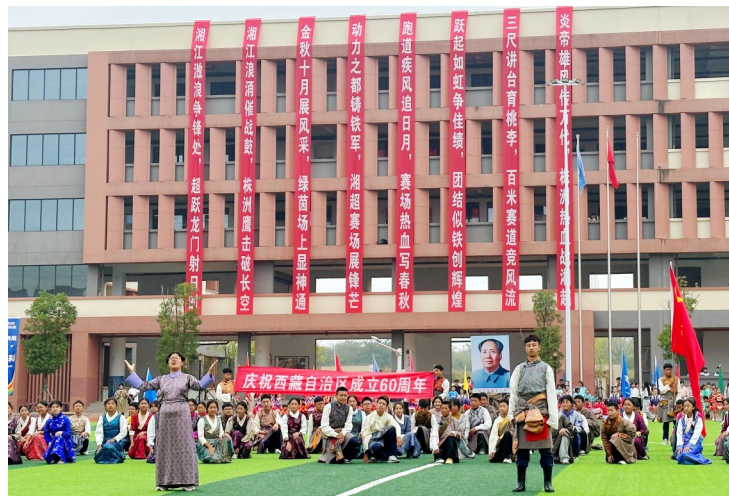
藏族学子载歌载舞庆祝西藏自治区成立60周年。