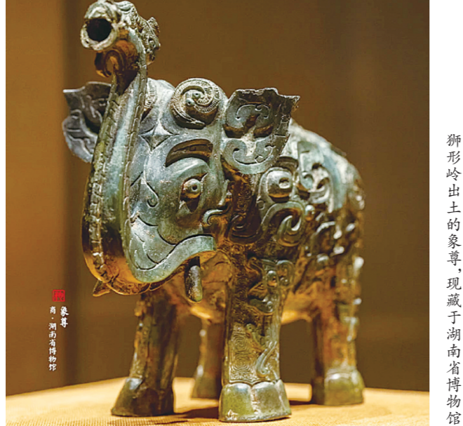
狮形岭出土的象尊，现藏于湖南省博物馆