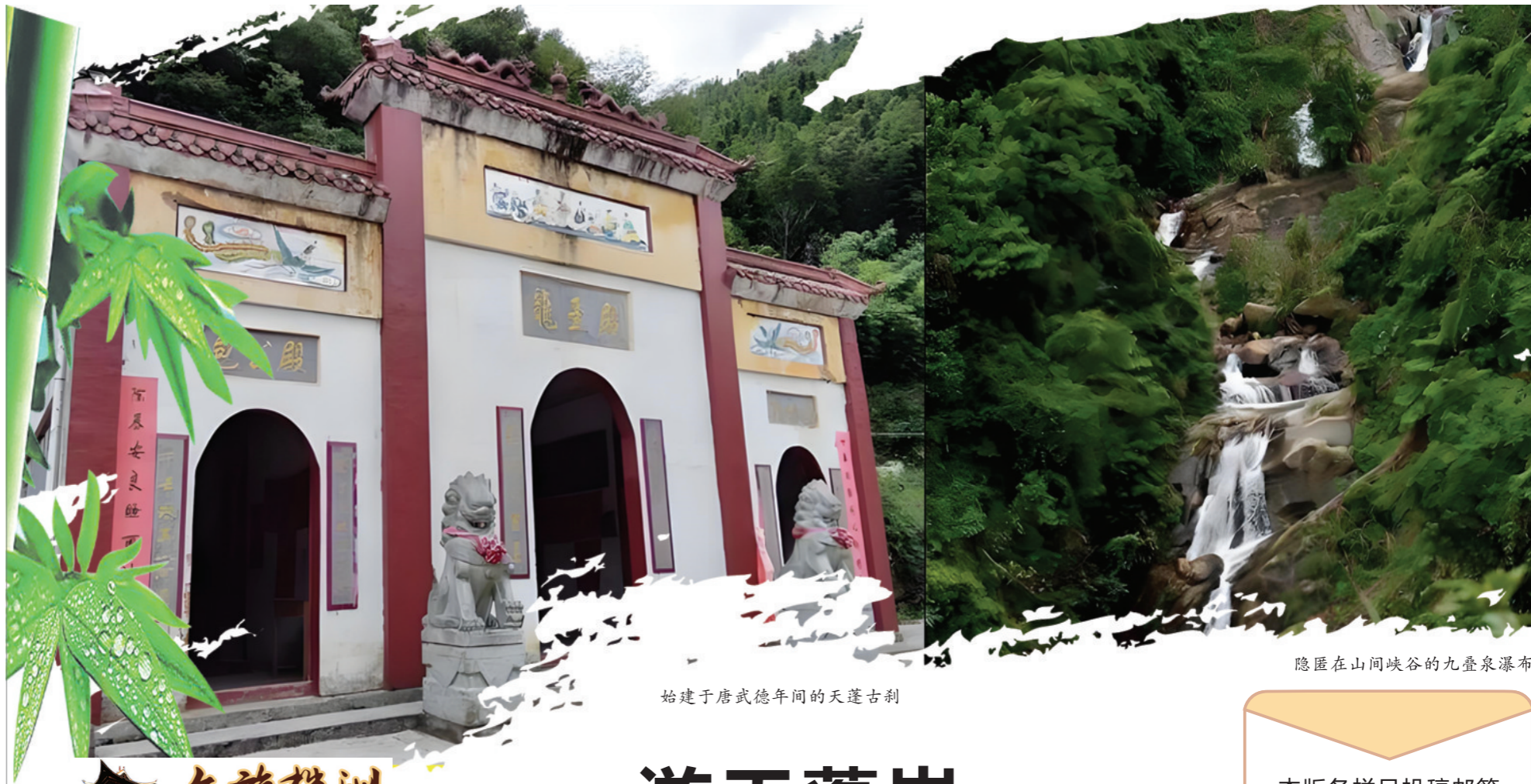
始建于唐武德年间的天蓬古刹