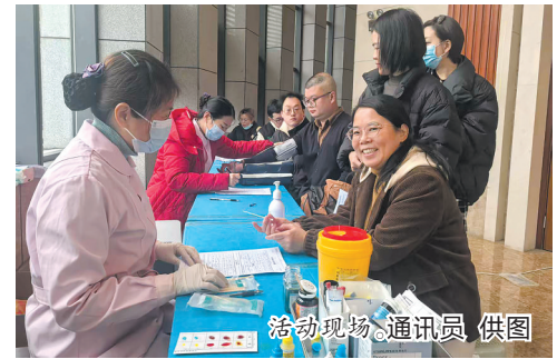
活动现场。

株洲日报讯(全媒体记者/董介 通讯员/曾蓓 彭碧莹)近日,株洲市中心医院开展本年度第二次全院医务人员无偿献血活动。来自临床、行政后勤等岗位的医务人员利用工作间隙,来到献血点。填表、初筛、献血等流程井然有序,爱心涌动。不少医务人员献血后稍作休整便即刻返岗。据悉,本年度两次活动累计328名医务人员踊跃参与。