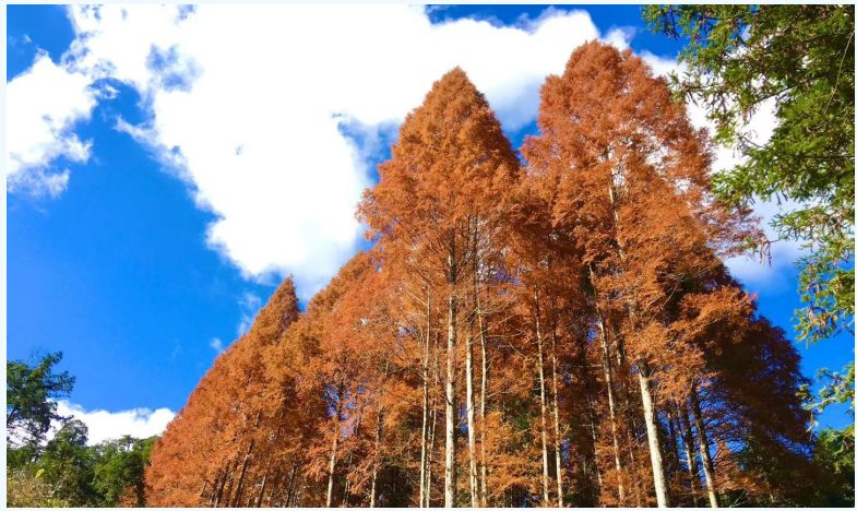
炎陵桃源洞自然保护区内的红杉林。

桃源洞的冬,因这一片片红杉而鲜活;红杉林的冬,因这方山野而湿润。走进武陵这片林野,听风,看树,与自然相拥,便知冬日的美好,从来藏在这疏朗与清宁里。