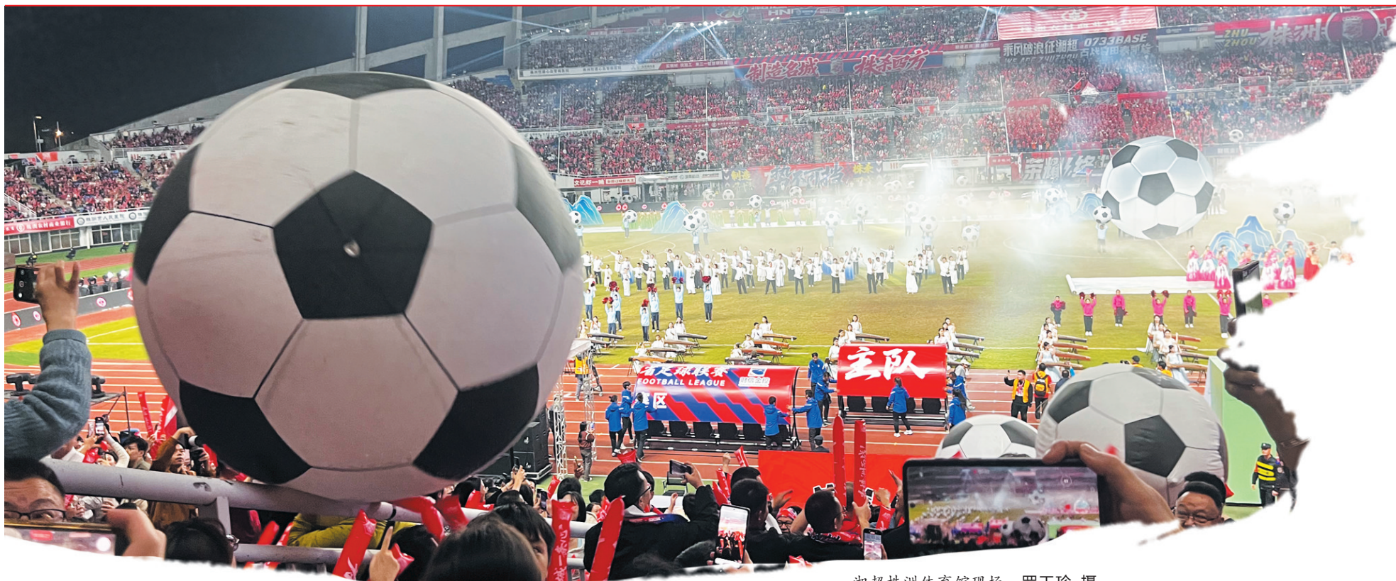
湘超株洲体育馆现场。