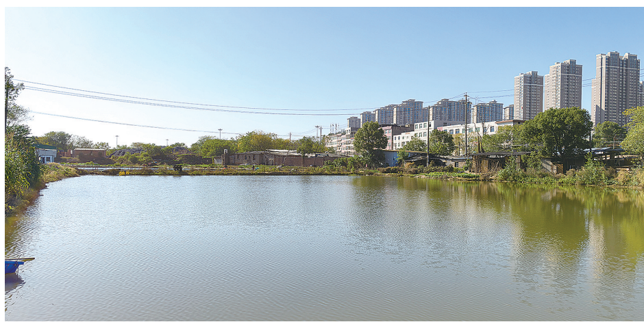
经过整治,株雷路旁的池塘已经由黑变绿。

“我们将争取不让一滴污水跑出去。”天元区住建局相关负责人表示。本次改造覆盖面积约0.26万平方米,收集南塘村和浅塘村约120户散户的生活污水,有效解决了城中村居民污水外溢的风险。