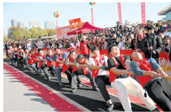
近日,天元区第二届群众拔河比赛山路街道分赛场赛事正酣,现场人气火爆。

当天,24强队伍还举行了“24进8”循环赛的抽签仪式,强队们将在本周和下周的周末,展开角逐,争夺本年度冠军。