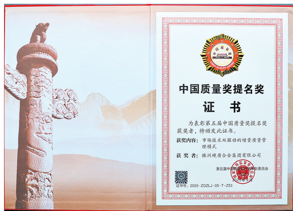
株硬集团荣获中国质量奖提名奖。

新中国诞生之初,万物复苏,百业待举。在这片充满希望的土壤上,硬质合金工业作为“一五”计划的156项重点工程之一,肩负着振兴民族工业的重任破土而生。株洲硬质合金厂——这颗中国硬质合金工业的种子,从此在湘江之滨深深扎根,挺起了中国硬质合金工业的脊梁。