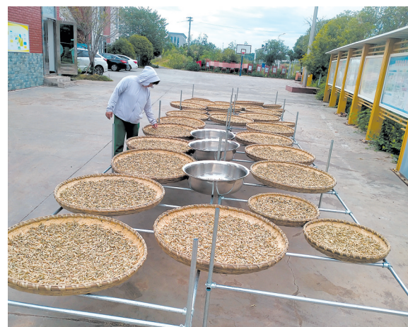
正在晾晒的干豆角。

“立足本土,特色发展,跳出三资抓经济,响塘社区用实际行动,走出了一条集体经济增收新路径,让小农副产品成为撬动社区经济高质量发展的大杠杆。”学林街道相关负责人介绍,此举不仅让社区闲置农产品变废为宝,完成从田间到餐桌的价值跃升,更直接带动集体经济增收,为后续扩大生产规模,开发更多特色品类积累了宝贵的资金与经验。