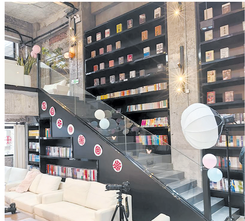
市民咖啡屋内景。