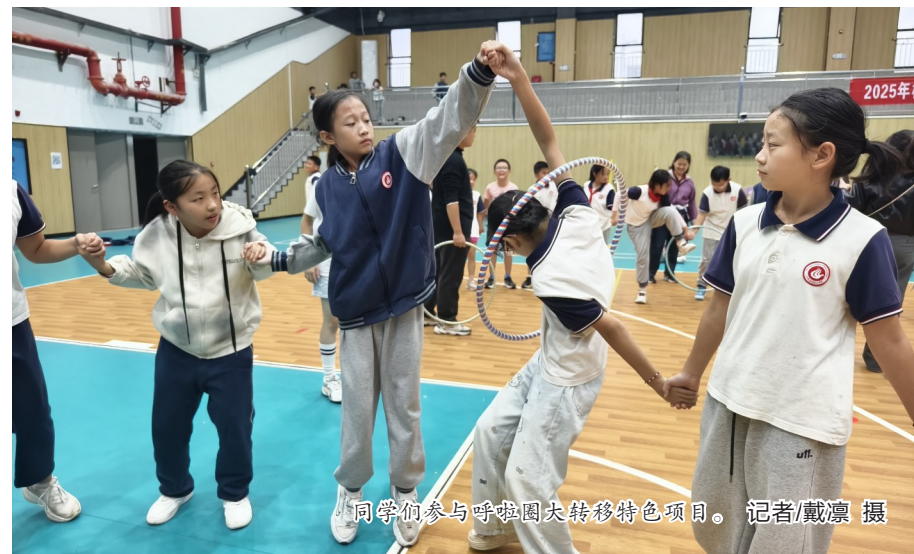
同学们参与呼啦圈大转移特色项目。

建校以来,学校坚持立德树人、五育并举,将德育渗透在细节里。通过推行“一班一品”特色班级文化,每个班级都有独特的文化符号;书香墨韵,或科创巧思,或运动活力。在运动会开幕式上,各班方阵精彩展示班级精神,实现运动与文化共舞,展现“枫”华正茂的学子风采。