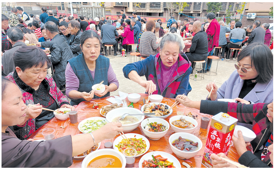
新民B安置小区,长桌宴现场。

株洲日报讯(全媒体记者/李逸峰) 10月29日,重阳节,石峰区各街道同时举办重阳暨幸福邻里节活动,开展邻里学、邻里乐、邻里亲、邻里帮等系列主题活动,拉近邻里间的距离,形成人人支持、户户参与、共同发展的良好局面,构建和谐幸福社区。