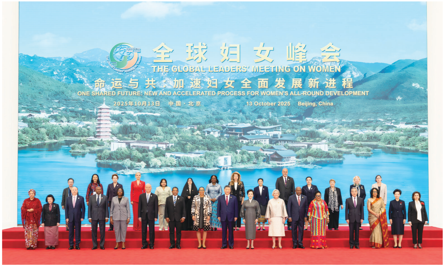
10月13日上午,国家主席习近平在北京国家会议中心出席全球妇女峰会开幕式并发表主旨讲话。