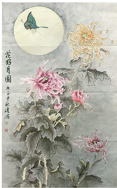
▲工笔画《花好月圆》(田琼)