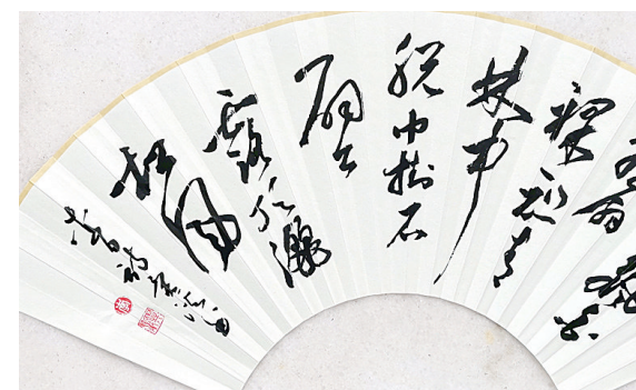
▲草书《夏日山中》(李异溪)