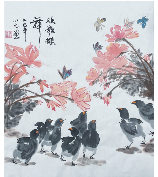
▲写意画《欢歌笑语》(成小元)

明月几时有,把酒问青天。不知天上宫阙,今夕是何年。人有悲欢离合,月有阴晴圆缺,此事古难全。但愿人长久,千里共婵娟。