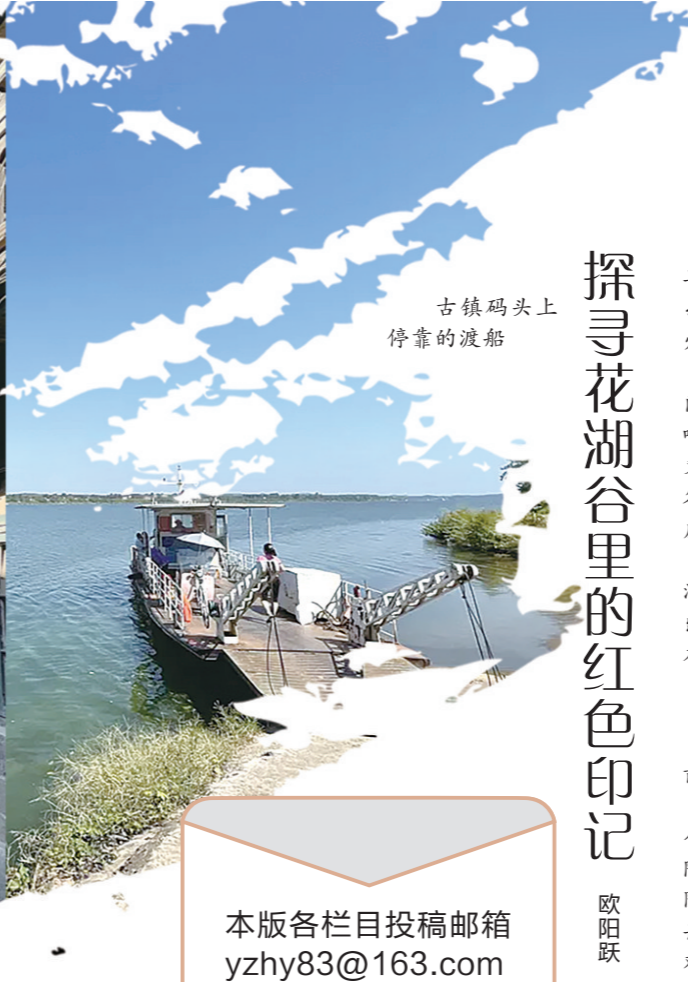
古镇码头上停靠的渡船