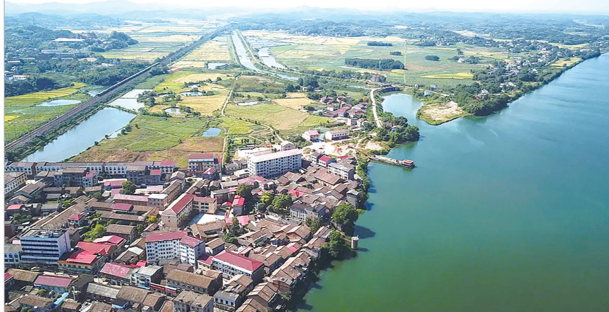
溯湘江而立的浣田古镇

花湖谷之旅落幕，我心潮澎湃。这片山谷，不仅有绿浪翻涌的生态之美，更有红色基因的深沉和厚重。它如一卷展开的史书，现场感十足地将我们拉入那段峥嵘岁月。回首来路，我更觉肩上责任重大：赓续先烈血脉，在新时代的征程中，书写属于茶陵的新荣光。