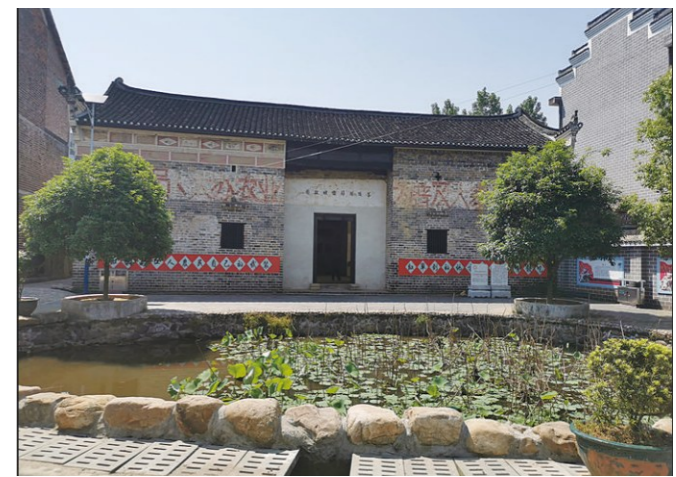
红色文化园内留存的茶陵县苏维埃政府旧址