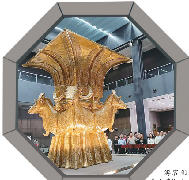
游客们通过“四羊方尊”,零距离感触3000年青铜文化的历史底蕴。