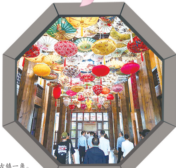
道林古镇一角。