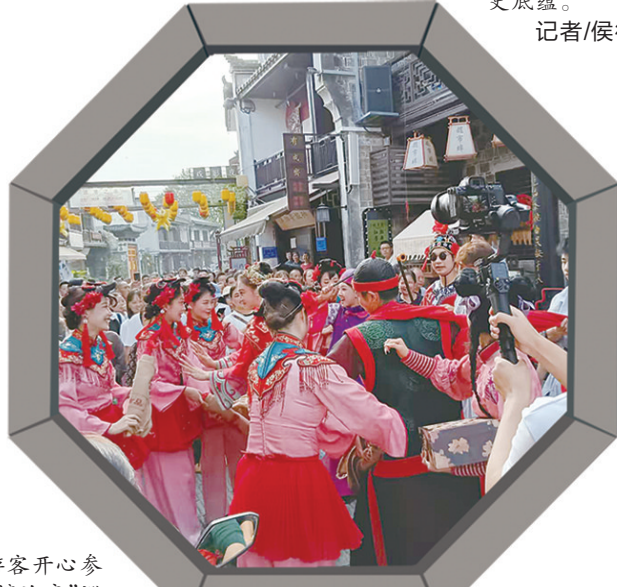
游客开心参与“喜嫁迎亲”巡游演艺活动,街上人头攒动。