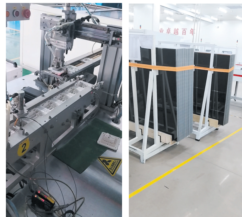
▲贵派工业园智能化生产线。 ▲中建材碲化碲发电玻璃产品。