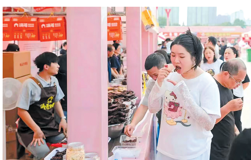
醴陵瓷博会现场,游客在琳琅满目的陶瓷展品中流连忘返。

富了游客的体验维度。第三届酱板鸭美食节以“醴陵酱板鸭,好鸭放心吃”为主题,近40家酱板鸭品牌集结,还同步设置了供销社助农兴农、亲子游乐天地等特色活动。图为游客免费品尝酱板鸭。