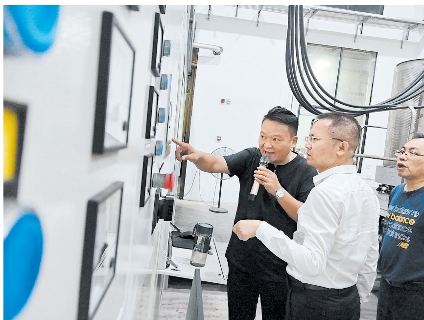
富欧科技企业负责人介绍项目情况。