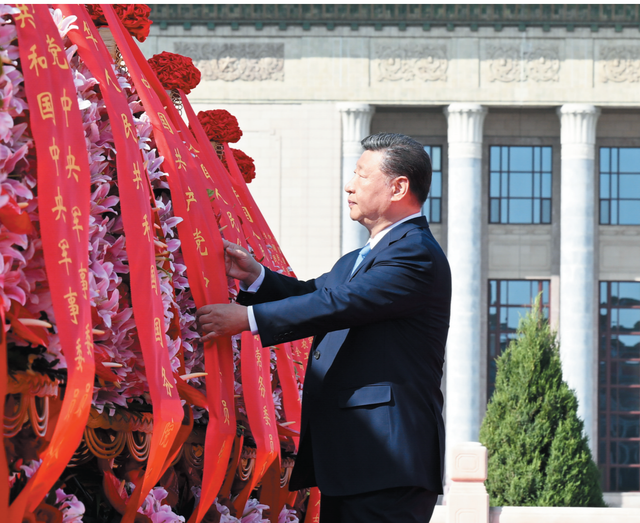
9月30日上午，党和国家领导人习近平、李强、赵乐际、王沪宁、蔡奇、丁薛祥、李希、韩正等来到北京天安门广场，出席烈士纪念日向人民英雄敬献花篮仪式。这是习近平整理花篮上的缎带。

新华社北京9月30日电 铭记英烈功勋，砥砺奋斗精神。烈士纪念日向人民英雄敬献花篮仪式30日上午在北京天安门广场隆重举行。党和国家领导人习近平、李强、赵乐际、王沪宁、蔡奇、丁薛祥、李希、韩正等，同各界代表一起出席仪式。