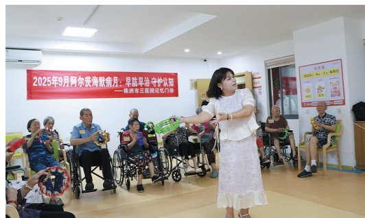
市三医院心理专家现场开展团辅活动。

株洲日报讯(全媒体记者/王芳 通讯员/李鹏)9月8日,株洲市三医院与株洲市普亲养老养护院举行双向转诊定点医院揭牌签约仪式。此次合作以“共筑长者健康防线,聚焦认知障碍照护”为目标,打破传统养老与医疗服务的壁垒,标志着株洲市在医养融合服务模式上迈出了坚实一步,恰逢“世界阿尔茨海默病月”,更为全市认知障碍长者及其家庭带来了福音。