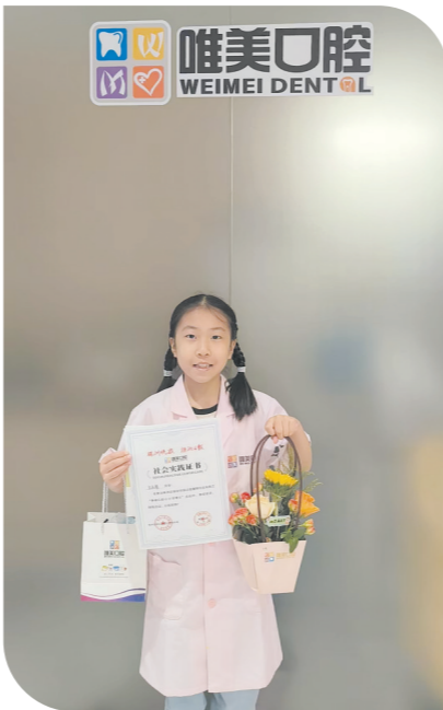
“瞧,这是我送给老师的礼物!”

瞧,最让人期待的插花环节来啦!插花活动里,小记者们拿着五颜六色的鲜花,认真地跟着老师学搭配。 剪枝、摆造型、系丝带,每一步都超用心。里面藏着大家最想对老师说的话:“老师,您辛苦啦!” 这个九月,有亮晶晶的牙齿,有香喷喷的鲜花,还有校园记者们甜甜的笑容——这大概就是教师节最美的样子啦!