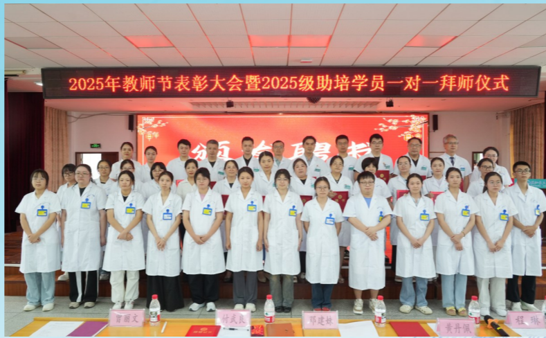
▲9月9日,三三一医院举行2025年教师节表彰大会暨2025级助培学员一对一拜师仪式。

医学知识与仁心仁术代代传承。他们既是“健康守门人”,更是“未来医生的摆渡人”。 作为湖南省助理全科医生培训基地、全科转岗医师培训基地、南华大学、湖南医药学院、长沙医学院等十多所院校的教学医院,三三一医院近年来始终把科教工作摆在战略高度,在党建引领、制度保障、师资建设和日常教学上持续发力,探索出一条独具特色的“医教研协同”之路。