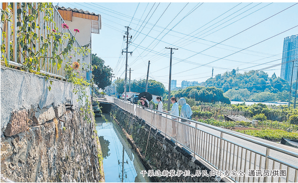
干渠边新装护栏,居民出行更安全。

票决之后,项目迅速付诸实施。8月25日,干渠边护栏安装工程圆满收官,筑起一道坚实的安全屏障。本月底,12盏路灯将全部安装完毕,为居民夜间出行提供照明指引,沿线居民出行不再担惊受怕。