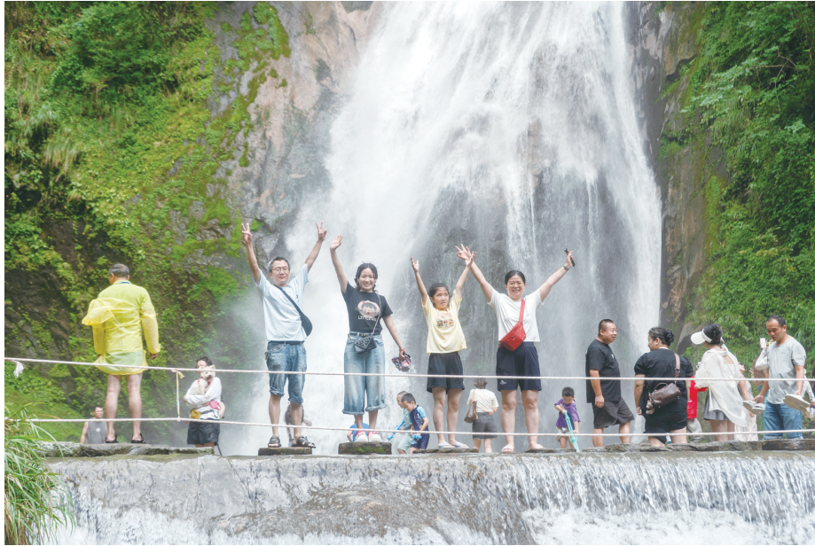
游客在神农谷景区游玩。