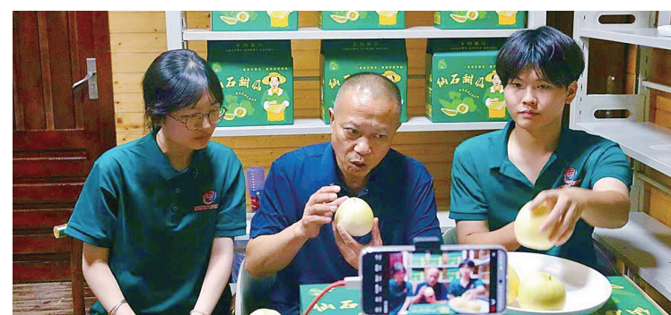
“语润乡兴”先锋队直播带货。通讯员供图

先锋队还以红色文化为纽带,组织留守儿童拜访当地“老党员、老干部、老教师”,聆听奋斗故事,学习奉献精神。在红色教育基地,队员们选取经典读物,用标准普通话逐篇朗读,引导孩子们掌握规范表达,并鼓励他们上台复述故事片段。这场“讲好红色故事”活动,既让革命精神扎根心田,也让普通话成为传递红色基因的生动载体。