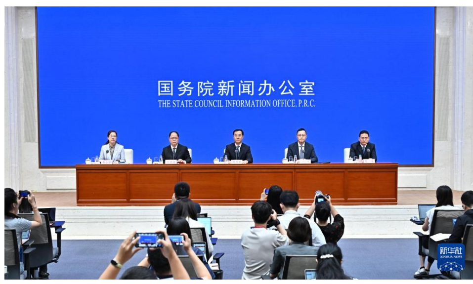
8月14日,国务院新闻办公室在北京举行“高质量完成‘十四五’规划”系列主题新闻发布会。

有的企业利用数据赋能智慧施肥,综合提升产量5.5%;有的企业依托海量测井数据开发出行业大模型,钻井决策效率提升15倍;有的企业利用公路货运行业数据实现司机与货主分钟级车货匹配,提升单车运行效率30%以