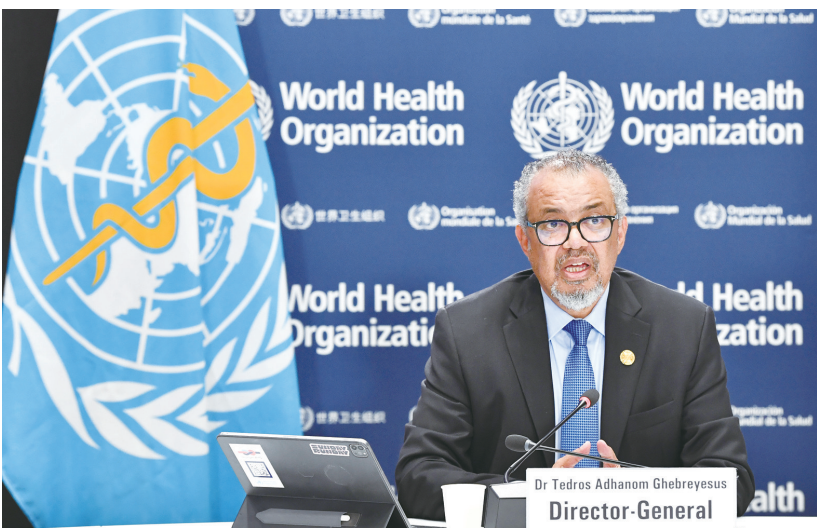
8月7日,在瑞士日内瓦世卫组织总部,世界卫生组织总干事谭德塞7日表示,以色列的封锁使加沙地带民众陷入饥饿和疾病,国际社会应持续提供粮食和医疗等人道援助。