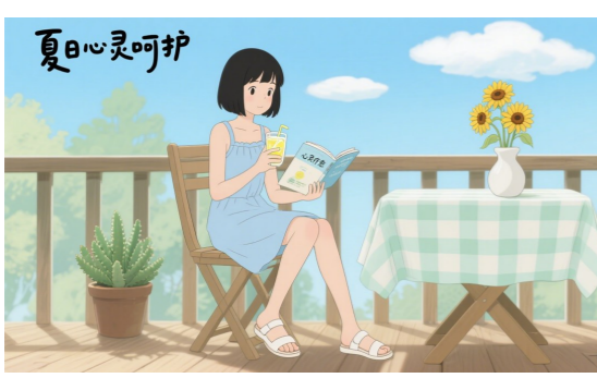
女性夏季心理调适

夏季高温炎热,日照时间长,人体易出现疲劳、烦躁、失眠等症状。而女性由于生理特点及激素水平变化,更容易受到情绪波动的影响,尤其是孕期、产后及更年期女性,可能因天气因素加重焦虑、抑郁等情绪问题。株洲市三医院女性精神一科关注女性