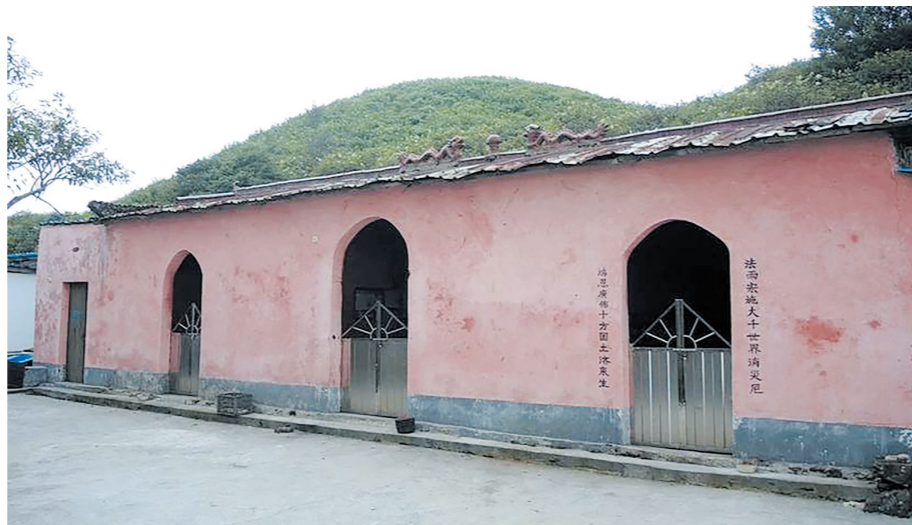
2009年，当年村民集资重修的和仙观。

攸邑民间传说，太和仙实即凤仙祠，建于唐宪宗时期（806-820），供奉洪氏娘娘。传说当地曾有椿象（俗名臭屁虫）为害，人们不堪其扰，洪氏娘娘为民消灾，把臭屁虫赶至太和山顶歼灭。民众感德，在山顶上立庙奉祀。现今，在春季蚊虫繁殖时节，在太和仙观可以见到密密麻麻的臭屁虫布满墙壁上，十分恶心。祠宇就地取材，土石为之，极为简陋。后乾隆、嘉庆、咸丰年间多次修缮，香火不断，尤以农历七月初一为盛。攸县、茶陵附近民众纷纷上山供奉香纸，顶礼膜拜。