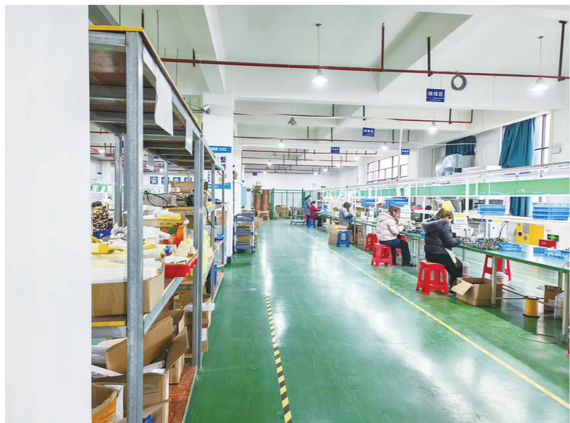
金鑫宇公司生产正酣。