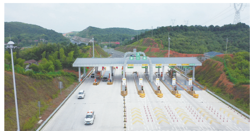
车辆通过洞口南收费站驶入醴陵高速。

株洲日报讯(全媒体记者/廖明 通讯员/夏四亮) 继去年12月31日醴陵高速石三门枢纽至娄底枢纽段建成通车后，7月29日上午11时08分，醴陵高速王仙枢纽至石三门枢纽段建成通车。这标志着G60沪昆高速醴陵至娄底段扩容工程——醴陵高速实现全线贯通。 醴陵高速的建设，不仅为我市东西向增加了一条高速通道，还对我市进一步融入国家高速公路网体系，加速长株潭一体化进程，都有重大战略意义。