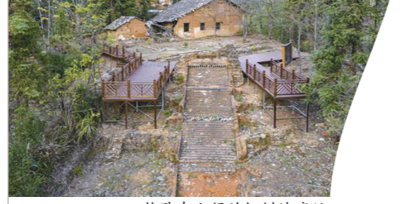
静卧在山间的枫树坡窑址