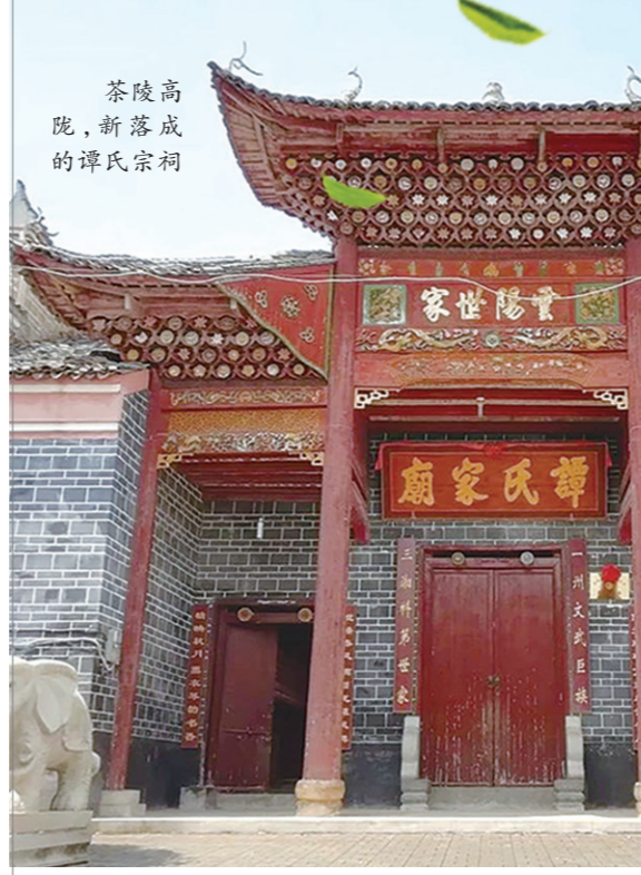
茶陵高院，新落成的谭氏宗祠