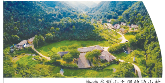
掩映在群山之间的沩山村