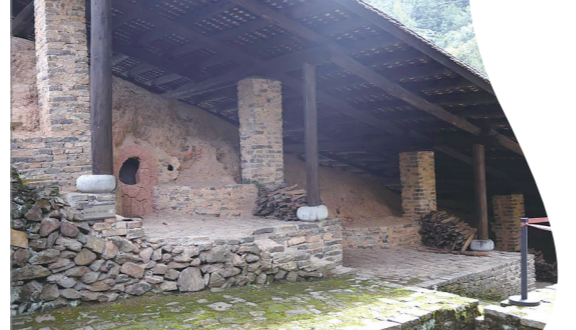
月形湾窑址，保存完好的阶级窑

沩山村的泥土里藏着时光尖锐的部分，刺向环形山与村庄的寂静。我时常去那里触摸青苔润染的瓷片，寻觅生坯凝固的千年流痕，以及流痕深处的烟火气。