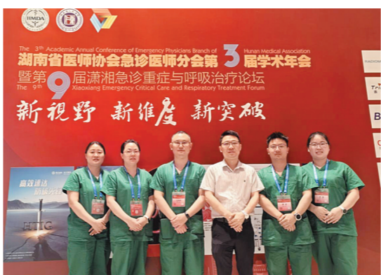
市人民医院急诊团队参与代表。

“以学促干,以赛砺能”。此次荣誉而归,不仅是对株洲市人民医院急诊团队实力的肯定,更激励着他们持续提升救治能力,为守护市民生命健康、建设健康株洲贡献更多力量。(廖静兰)