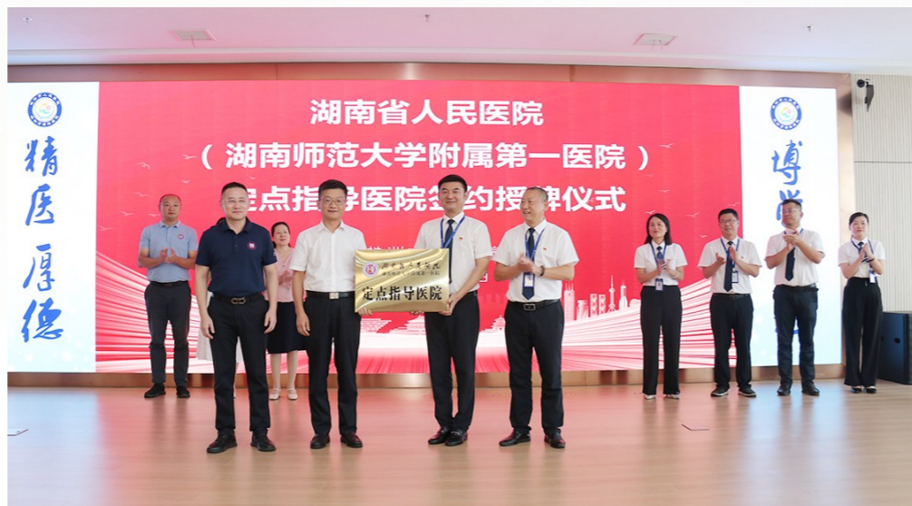
湖南省人民医院与株洲市人民医院举行定点指导医院签约授牌仪式。