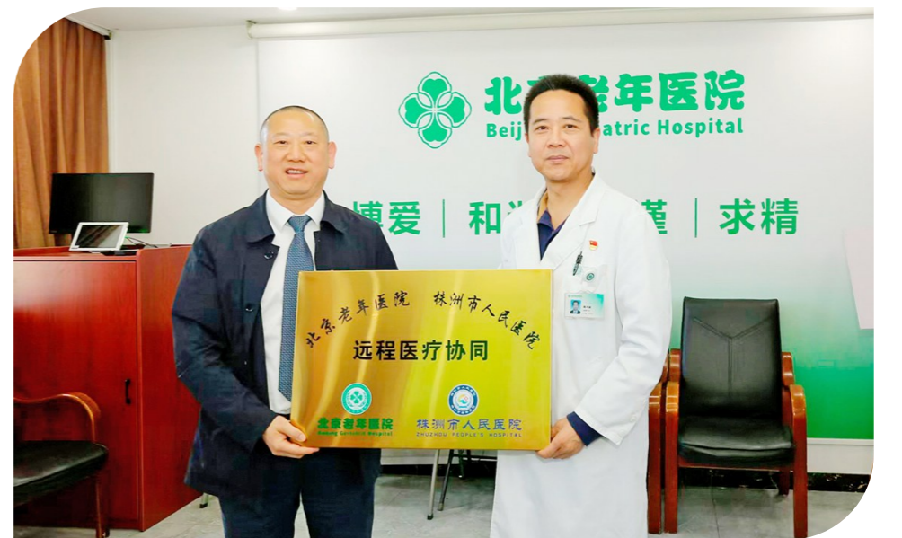
北京老年医院正式授予市人民医院“远程医疗协同单位”的牌匾,京珠两地老年医学深度合作迈入新阶段。