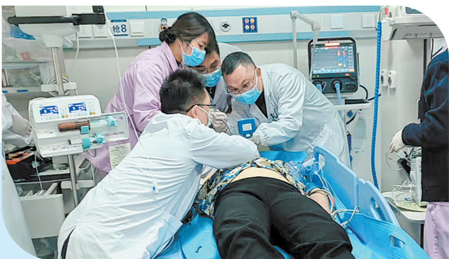
时间就是生命。在急诊、急救领域,去年以来,市人民医院通过学科共建完成蜕变,造福患者。