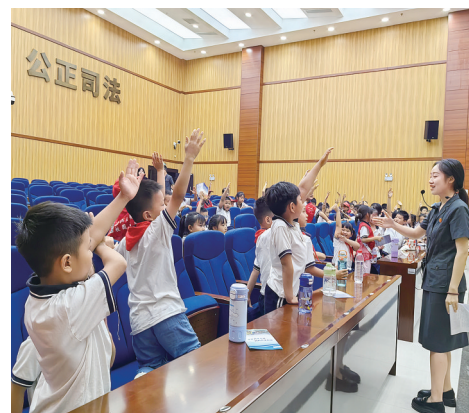
小记者们踊跃参与法治知识抢答。

“没想到毒品离我们这么近,伪装得这么像普通零食,太可怕了。”来自2409班的小记者朱同学边记笔记边说:“我得回去告诉同桌,陌生人给的零食千万不能要!” 据悉,涪陵区人民法院将持续创新青少年法治宣传教育模式,通过“请进来”与“走出去”相结合,为构建无毒校园、法治社会筑牢青春防线。